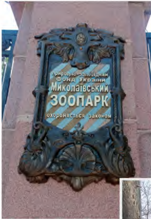
Sign of the object of the nature reserve fund

Summing up, we can say that despite the war, the necessary and possible amount of work was performed in all areas of the zoo's activity during 2024.