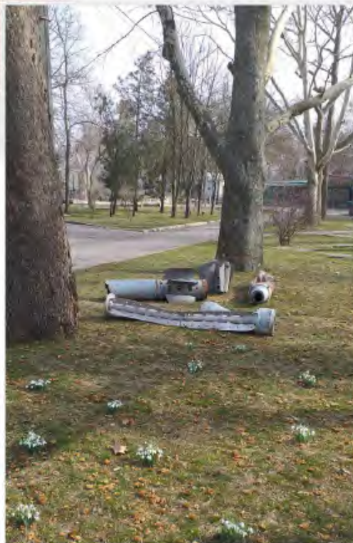
The war continues, but life wins.