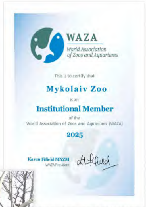
Mykolaiv Zoo received the WAZA 2025 certificate confirming its membership in this association