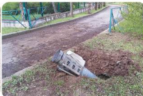
На територію зоопарку під час війни впало 8 ракет