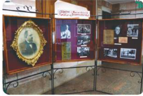
Презентація книги «Миколаївський зоопарк в фотографіях і документах».

зоопарку на суму 44220 грн. За результатами первинної атестації робочих місць та відповідно до чинних законодавчих актів України встановлено наступні пільги і компенсації за шкідливі і важкі умови праці на всіх зоологічних відділах: