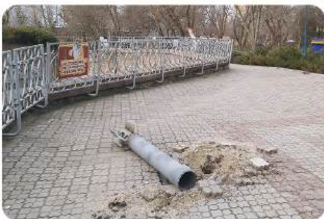
Перша ракета, яка впала на територію зоопарку

У 2022 році за час війни на територію Миколаївського зоопарку впали частини 8 реактивних снарядів від різних видів реактивних систем залпового вогню.