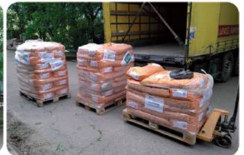
Гуманітарна допомога для слонів з Німеччини