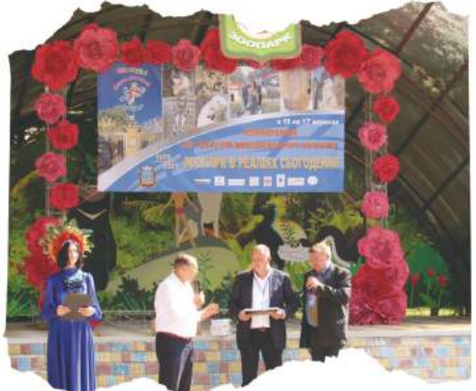
Відкриття конференції в зоопарку

12 грудня 2019 року в Центральній бібліотеці ім. М.Л. Кропивницького відбулася презентація нової колекційної фотокниги «Миколаївський зоопарк в фотографіях і документах» (автор В.М. Топчий).