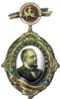
Орден М.П. Леонтовича