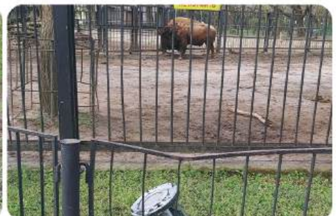
Ракета біля вольєру з бізоном