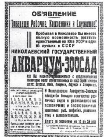
Афіша зоопарку 1938 рік