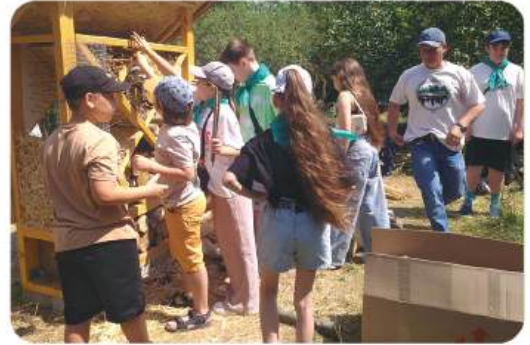
Готель для комах

28 травня 2025 року Миколаївський зоопарк отримав гуманітарну допомогу – корм для слонів виробництва «Intira GmbH ZOO ANIMAL FOOD» у кількості 78 мішків загальною вагою 1950,00 кг. Корм надала німецька асоціація ELEFANTEN-SHUTZ EUROPA e.V., яка виступає як об'єднання людей, які піклуються про долю слонів, чиє фізичне чи психічне здоров'я прямо чи опосередковано перебуває під загрозою. Ми вдячні нашим німецьким партнерам за цінну допомогу для наших слонів та сподіваємось на подальшу плідну співпрацю.