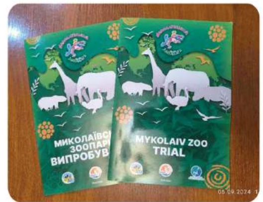
Брошура "Миколаївський зоопарк Випробування"

У вересні 2024 року було видано нову брошуру «Миколаївський зоопарк. Випробування.», в якій йдеться про досвід роботи зоопарку в період повномасштабного вторгнення російської федерації. У тяжкий воєнний час Миколаївський зоопарк продовжує співпрацювати з міжнародною зоопарківською спільнотою, у тому числі з Всесвітньою асоціацією зоопарків і акваріумів (WAZA), куди наш зоопарк, єдиний із зоопарків України, був прийнятий у 2003 році. Завдяки співробітництву з подібними організаціями, ми обмінюємось цінним досвідом і знаннями. Ми відправили англійські примірники брошури нашим колегам за кордон, в тому числі в головний офіс WAZA в Барселоні.