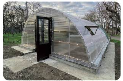
Проект «Еко-теплиця у зоопарку», який здійснила громадська організація «РУМ» – за власний рахунок і власними силами

питань захисту природи та значний внесок в розвиток Миколаївського зоопарку та зоопарківської справи.