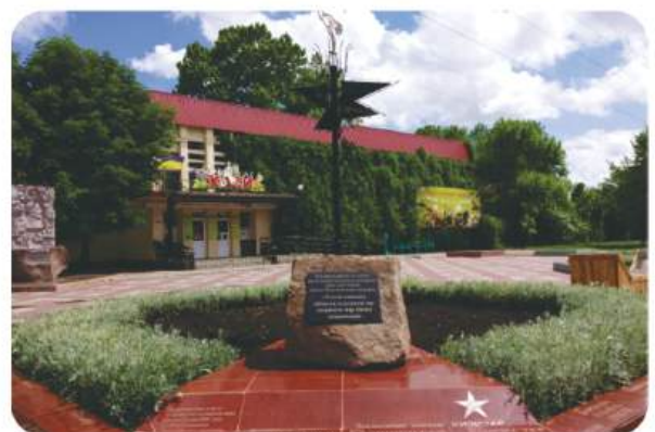
Пам'ятний знак співдружності зоопарків світу