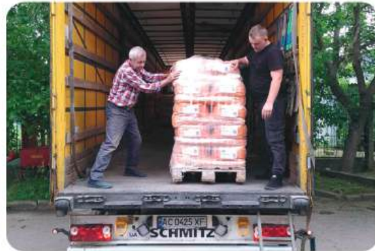
Гуманітарна допомога для зоопарку